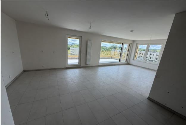
séjour de l'appartement 042 à Esch-sur-Alzette