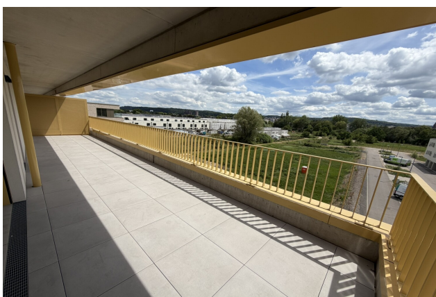
terrasse de l'appartement 042 à Esch-sur-Alzette