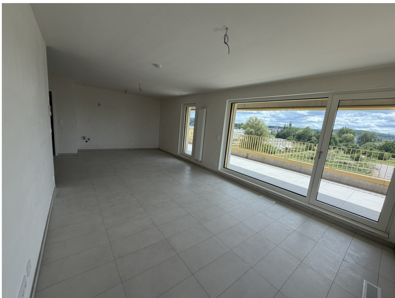
séjour de l'appartement 042 à Esch-sur-Alzette