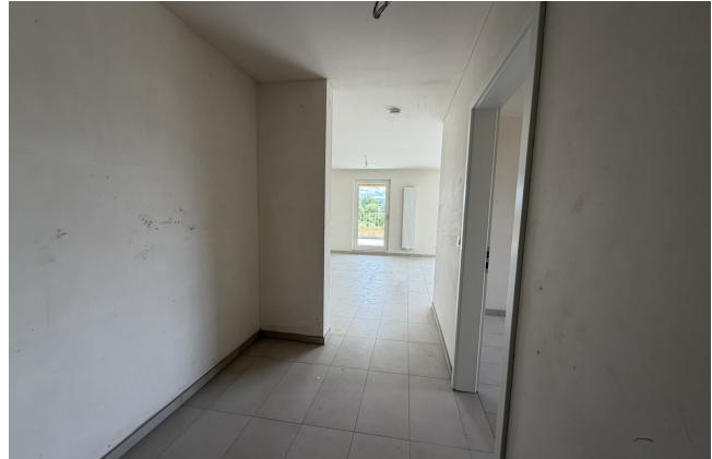
couloir de l'appartement 042 à Esch-sur-Alzette