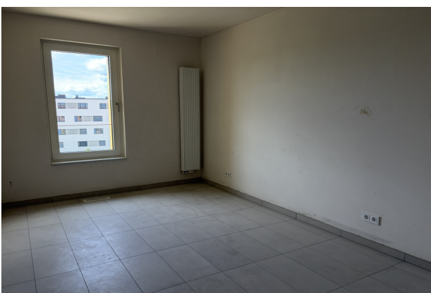
chambre de l'appartement 042 à Esch-sur-Alzette