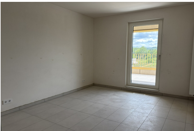
chambre de l'appartement 042 à Esch-sur-Alzette