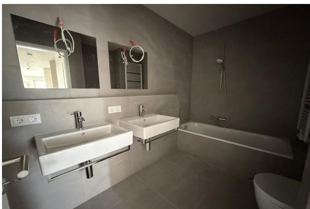
salle de bains de l'appartement 042 à Esch-sur-Alzette