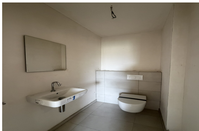
WC séparé de l'appartement 042 à Esch-sur-Alzette