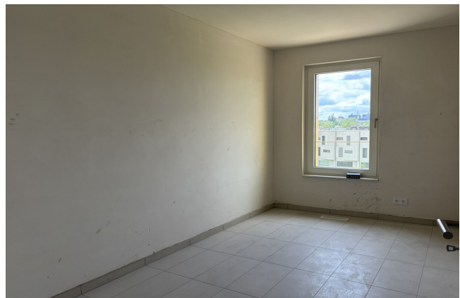
chambre de l'appartement 042 à Esch-sur-Alzette