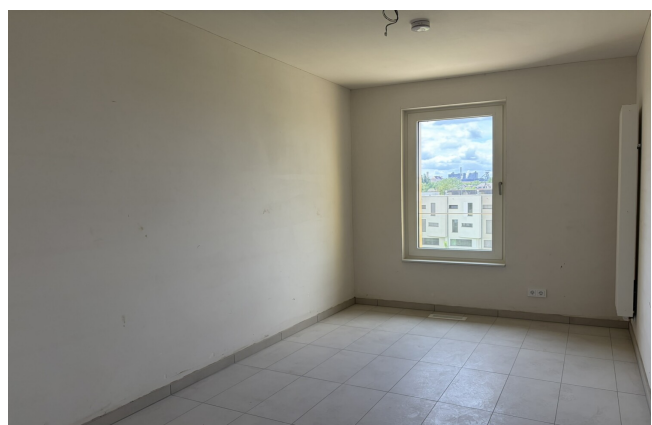
chambre de l'appartement 042 à Esch-sur-Alzette