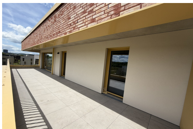
terrasse de l'appartement 042 à Esch-sur-Alzette