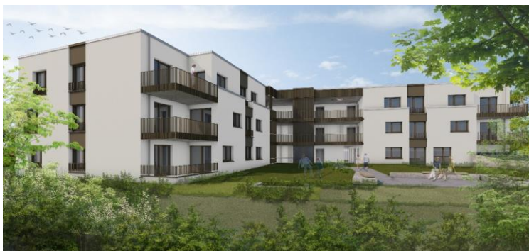
Image non contractuelle