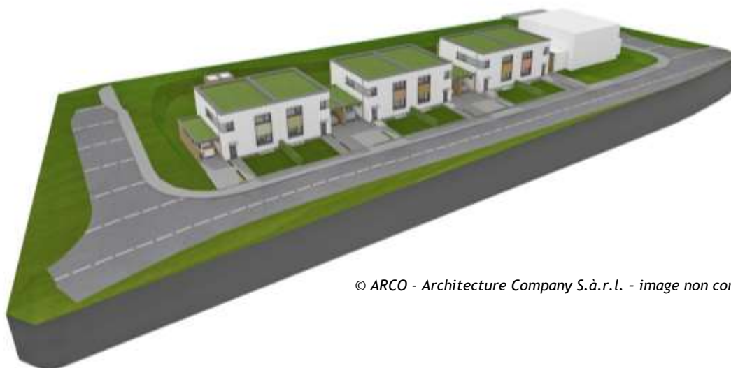
© ARCO - Architecture Company S.à.r.l. - image non contractuelle

Les candidats-acquéreurs intéressés par ce projet doivent soumettre leur dossier de candidature auprès de la SNHBM. Pour plus d'informations, veuillez consulter les pages 6 et 7 reprenant les conditions de vente générales, ainsi que des explications relatives aux droits d'emphytéose et de préemption (identiques pour ce projet).